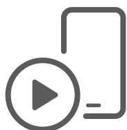
NASTAVENÍ A OVLÁDÁNÍ