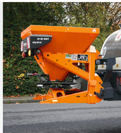
Nesené za kolovým nakladačem*