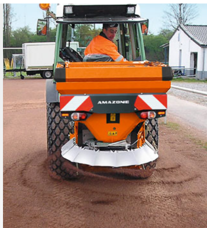
Rozmetání červeného popílku