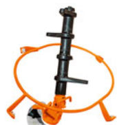
Prstový čechrač na písek a sůl