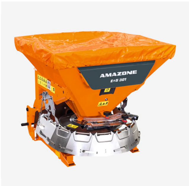
Rozmetadlo E+S 301 s objemem nádrže 300 litrů

Úspora nákladů – ochrana životního prostředí