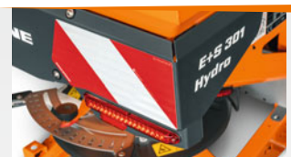
Osvětlení LED v silničním provozu nebo konvenční osvětlení