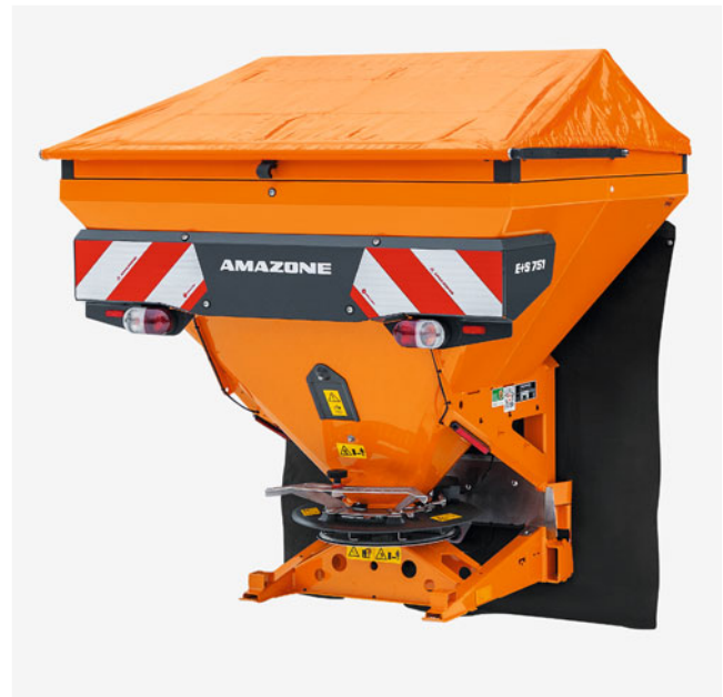
Nesené rozmetadlo E+S Hydro 751 + S 180 s objemem nádrže 750 litrů a nastavcem nádrže 180 litrů