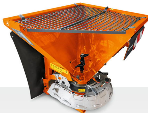
Řez modelu rozmetadla E+S s prstovým čechračem na písek a sůl