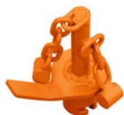
Řetězový čechrač na směs štěrku se solí